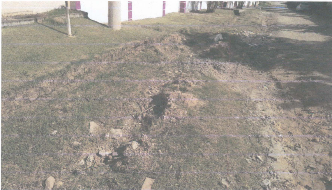
- Rua Benjamin Constant, Bairro Itaoca