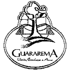
TABELA I - PLANTA GENÉRICA DE VALORES